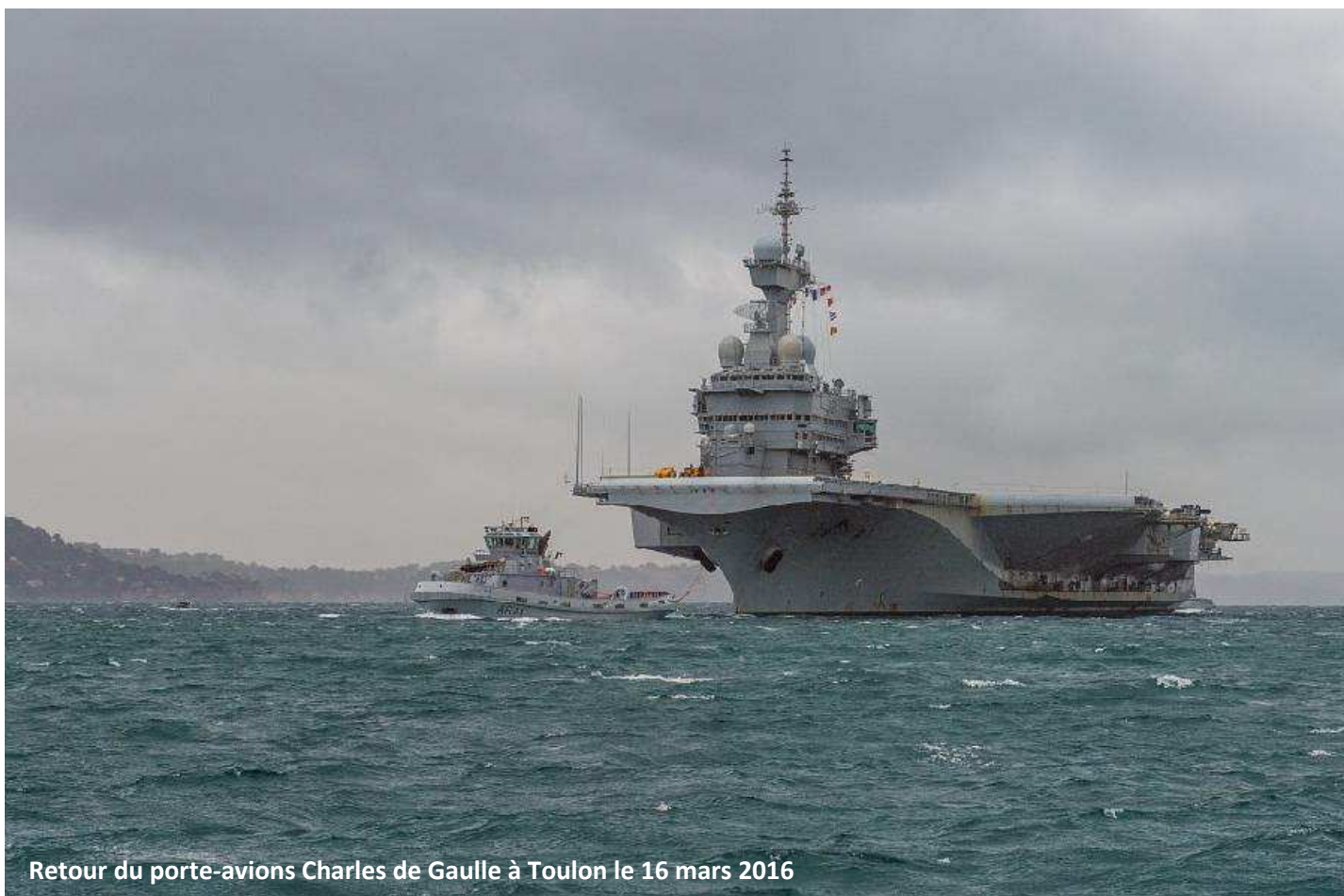
Retour du porte-avions Charles de Gaulle à Toulon le 16 mars 2016