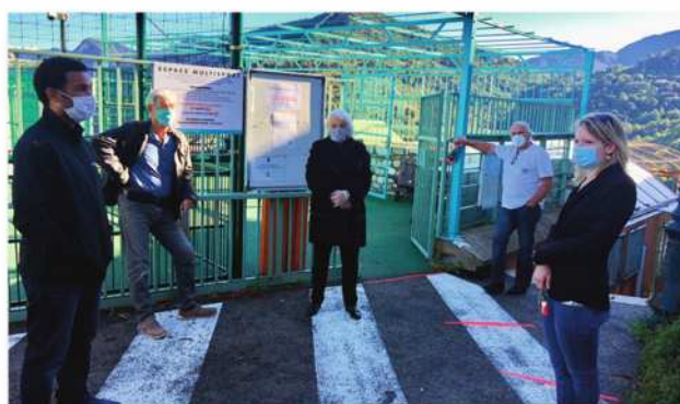
Nous sommes prêts pour accueillir les enfants