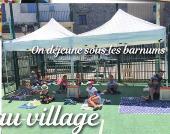
On déjeune sous les barnums