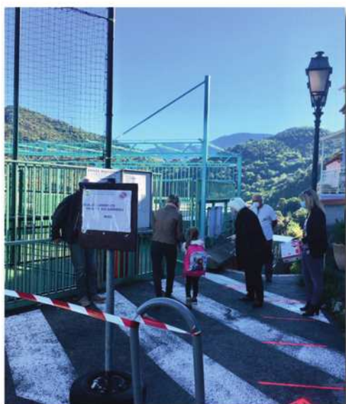
Rubalise et marquage au sol...