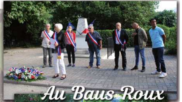
Au Baus Roux

Les enfants ont eu le privilège de déposer la gerbe devant le monument aux morts. Tout en respectant les gestes barrières, l'affluence fut au rendez-vous pour cette cérémonie.