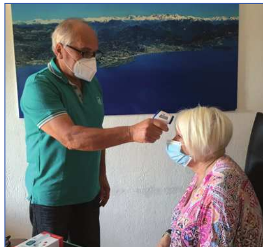
Afin de prendre soin des autres, nous avons travaillé en prenant soin de nous