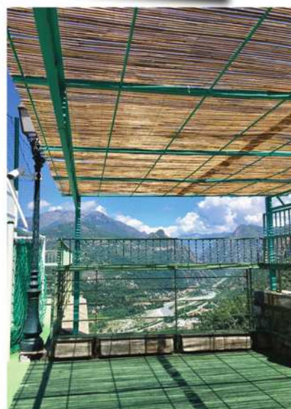
Des cannisses offrent un peu d'ombre aux enfants