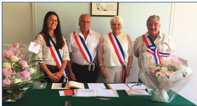
Le premier mariage du mandat