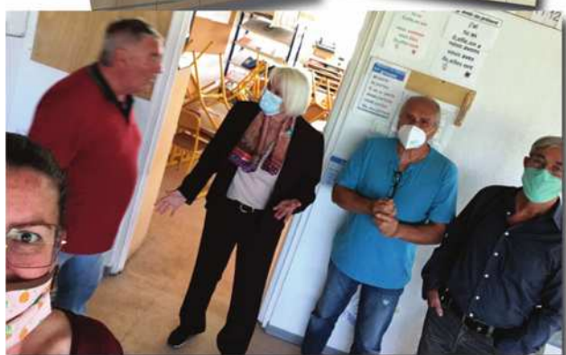
Réunion de chantier pour la pose de la climatisation