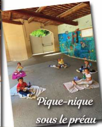
Pique-nique sous le préau