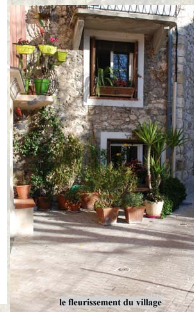
le fleurissement du village

Direction de la publication : Paule BECQUAERT, Maire Rédaction : Nicole LABBE, 1ère Adjointe, déléguée à la Communication Infographie : Sandrine DALMASSO, Adjoint administratif Avec l'aimable participation des élus, des responsables des associations de La Roquette sur Var Fac Copies Imprimeur