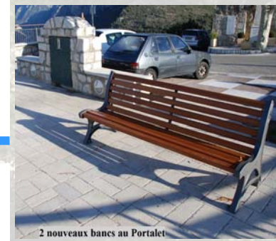
2 nouveaux bancs au Portalet