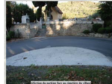
réfection du parking face au cimetière du village