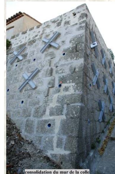
consolidation du mur de la colle

Des réunions ont lieu régulièrement avec les services de la Métropole NCA et le SIVOM Val de Banquière, pour faire le point des différents dossiers, afin de satisfaire les demandes qui nous sont adressées.