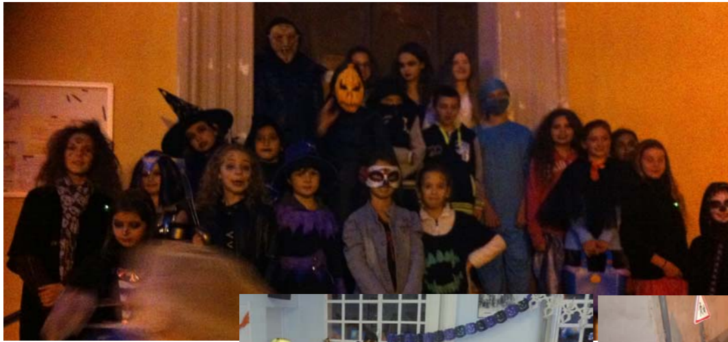
Organisées par l'A.P.E du village, le 31 octobre...