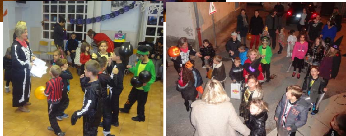
...et par l'A.P.E de Baus-Roux, le 7 novembre