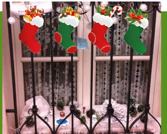
Un grand merci à l'Association Roc et Tan Rêvent qui, cette année encore, nous invite à une merveilleuse promenade féerique, pour découvrir l'aventure littéraire d'un village au Pays de Noël ...