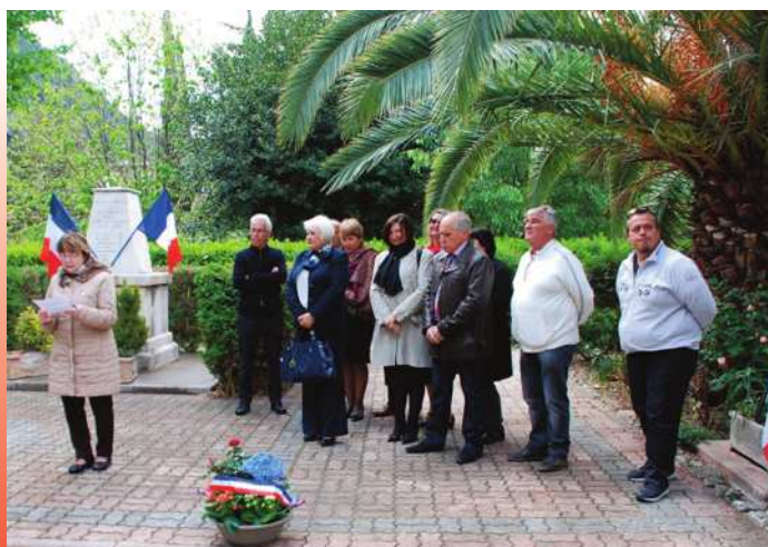
Dépôt de gerbe en souvenir de la journée nationale du souvenir de la déportation