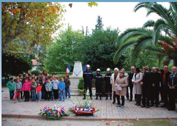
Cérémonie du 11 Novembre 1918