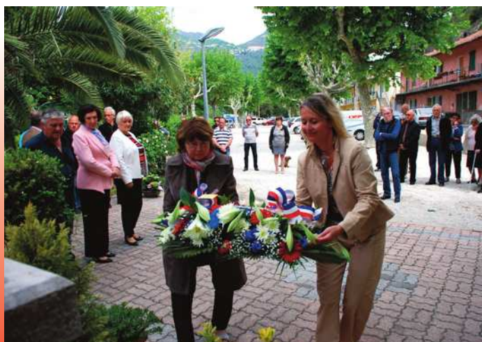
Cérémonie du 8 Mai 1945