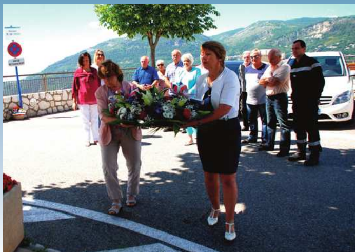
Commémoration de l'appel du 18 juin 1940