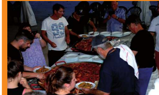
Du 8 juillet au 17 juillet : Les festivités du Comité des fêtes du hameau de Baus-Roux avec le festival du rock, le concours de boules et la soirée paëlla