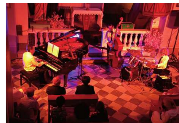
Les 3 et 19 août : Les Soirées estivales "What Elle's", place de l'Eglise et "Philippe Villa Trio" dans l'Eglise