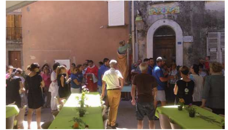
Du 26 juin au 03 juillet : Fête de la Saint Pierre du Comité des fêtes du village