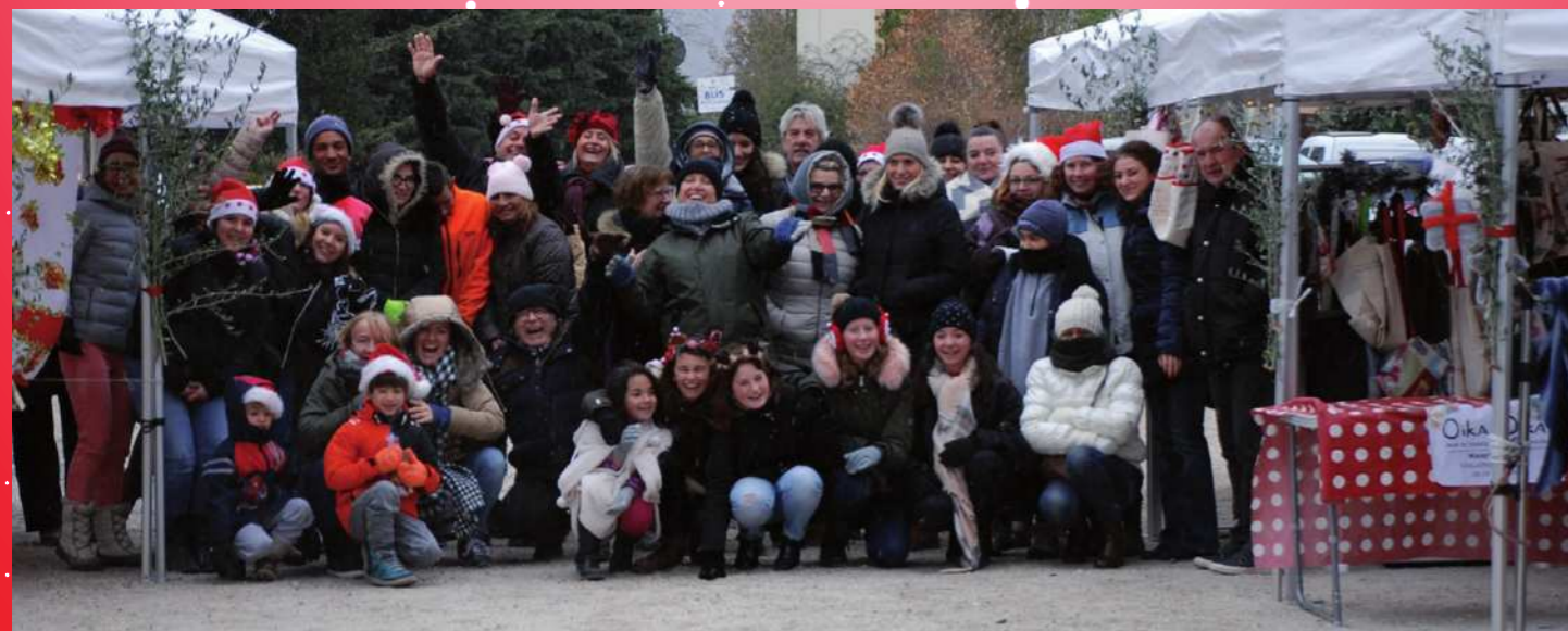
Le 10 décembre : Marché de Noël de Roc et Tan rêvent et spectacle offert par La Métropole Nice côte d'Azur