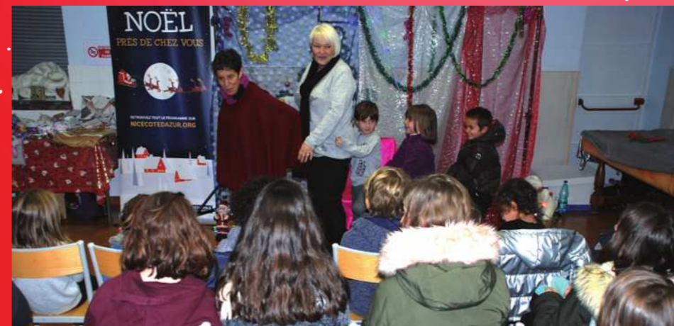
Le 16 décembre : Noël de l'APE de l'école du hameau de Baus-Roux