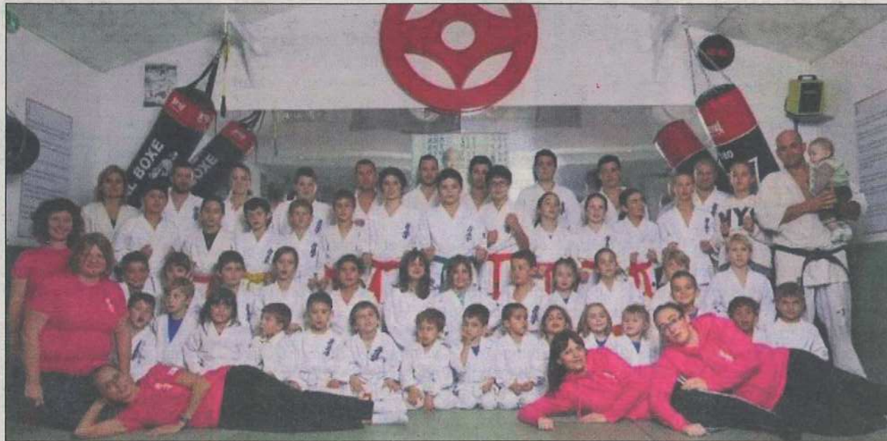
L'Issa Kyokushinkai de La Roquette-sur-Var, un club de karaté qui monte qui monte.