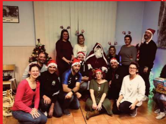
21 DECEMBRE : Fête de Noël de l'APE du village