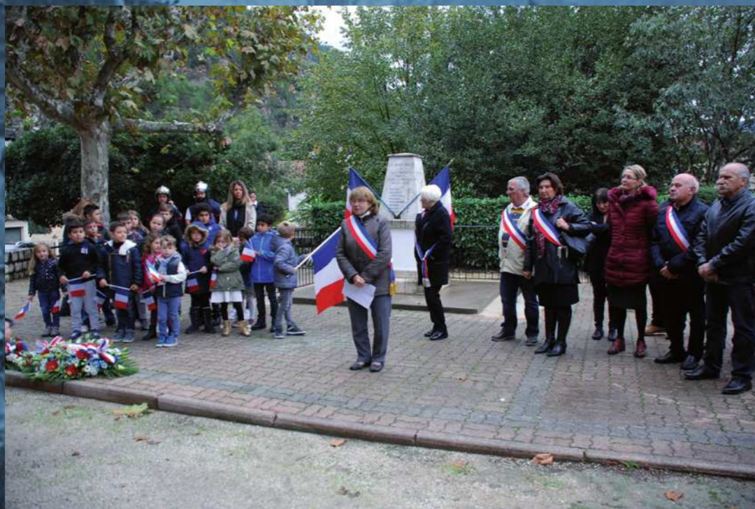
Cérémonies du 18 juin au hameau

Pour honorer comme il se doit ce centenaire, les parents d'élèves et les habitants ont été conviés par la municipalité à un buffet déjeunatoire à la mairie annexe du hameau de Baus-Roux.