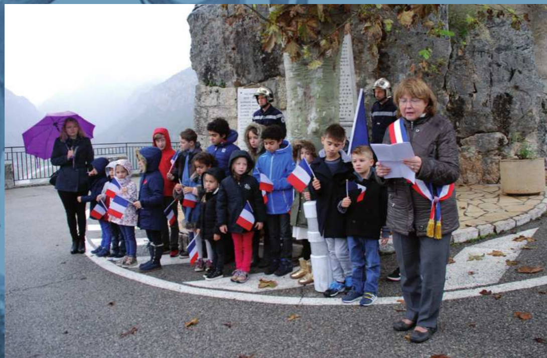
Cérémonies du 18 juin au village

Centenaire de la cérémonie du 11 Novembre 2018 au village et au hameau