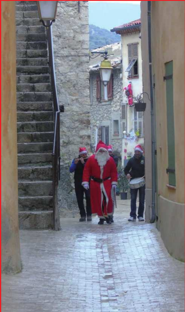
16 DECEMBRE : Fête de Noël du Comité des fêtes du village