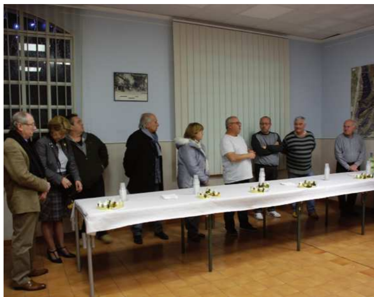
04 JANVIER 2019 : Vœux de l'OCBR