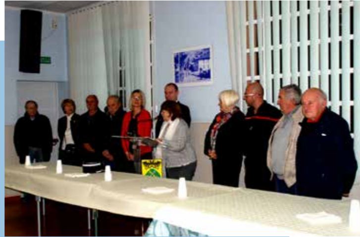
17 JANVIER 2020 : Vœux du maire au Hameau de Baus-Roux