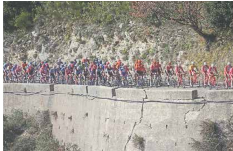
22 FEVRIER 2020 : Notre beau village a été mis à l'honneur avec la course cycliste du Tour des Alpes-Maritimes et du Var, avec de belles photos du journal Nice-Matin.