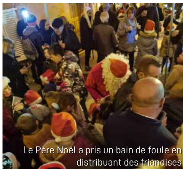
Le Père Noël a pris un bain de foule en distribuant des friandises

Ainsi s'achevait cette belle journée du 18 décembre. Le lendemain les Roquettans et Roquettans ont pu profiter à volonté de la patinoire toute la journée, avant son démontage... Reviendra-t-elle ?