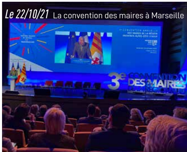
Le 22/10/21 La convention des maires à Marseille

Le Maire en compagnie de Gérard Larcher, Président du Sénat