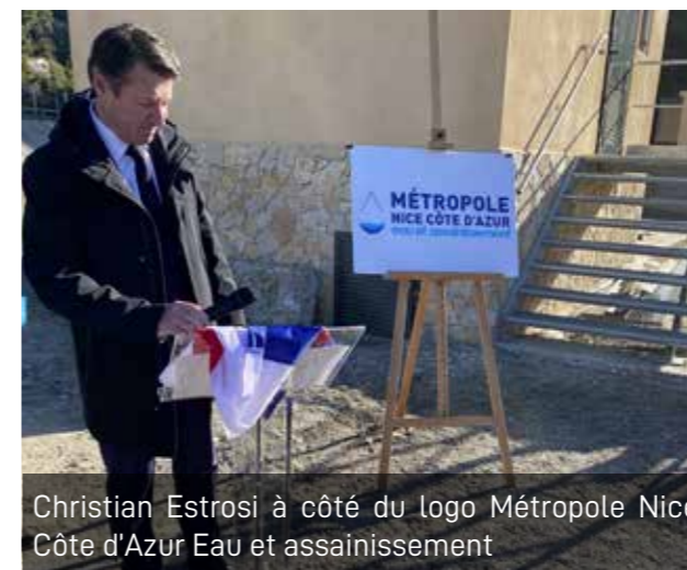
Christian Estrosi à côté du logo Métropole Nice Côte d'Azur Eau et assainissement