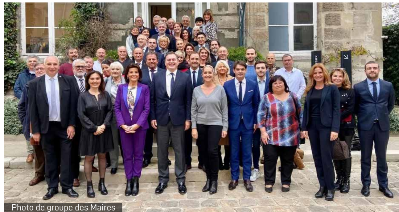
Photo de groupe des Maires