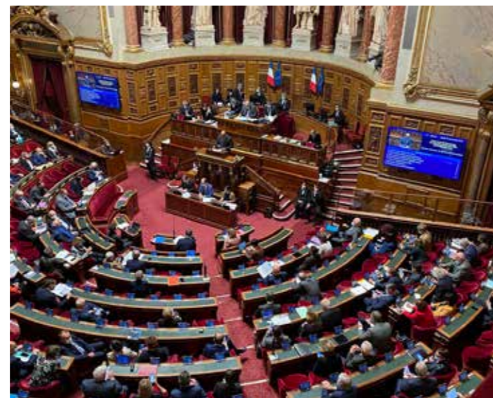
Vue plongeante sur l'hémicycle.