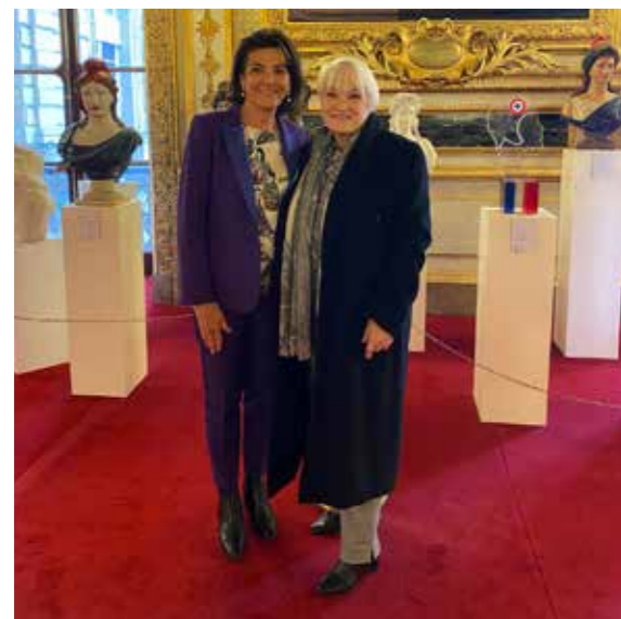
Le Maire en compagnie de la Sénatrice, Dominique Estrosi-Sassone