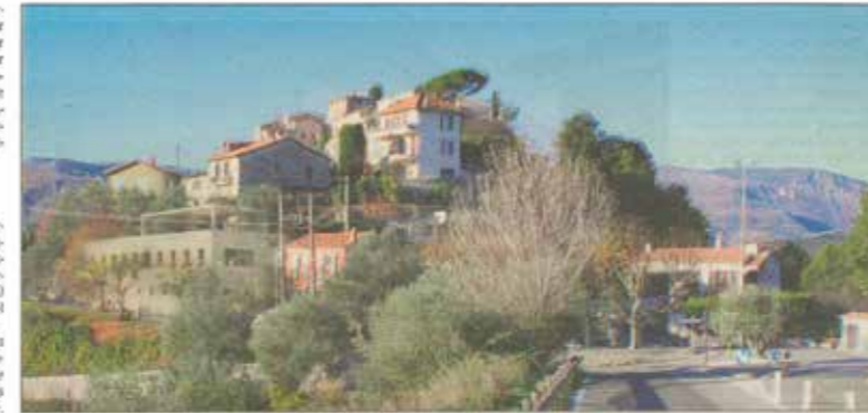
La future salle polyvalente (à gauche) et ses ouvertures tournées vers le sud.

« Le challenge était pour nous d'imaginer ce bâtiment sans dénaturer l'identité du village, comme si cette structure avait toujours été présente », précise-t-elle. Pour relever ce « challenge », le bâtiment sera constitué d'un rez-de-jardin, obtenu après un décaissement du sol naturel, d'un premier niveau, équipé de larges ouvertures dirigées vers le sud, et d'un toit terrasse. Doté de tous les aménagements permettant une complète polyvalence, cet espace est appelé à devenir un lieu de vie pour les habitants. La maîtrise d'œuvre est confiée au Sivom (syndicat intercommunal à vocation multiples) Val de Banquière. Responsable des marchés publics au sein de la structure, Bruno Bitoun annonce « une livraison début 2024. La réalisation doit durer une année avec les premiers actes fin 2022 ».